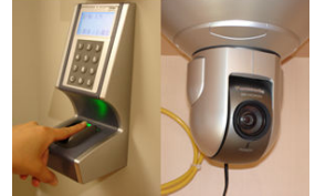
クッション壁面や静脈認証入館システム、WEBカメラなど、安全性を追求した施設です。